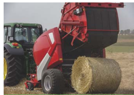
Podczas wyładunku biał na nierównym terenie należy zachować szczególną ostrożność.

Sworzeń zaczepowy zabezpieczony przed wypadnięciem.