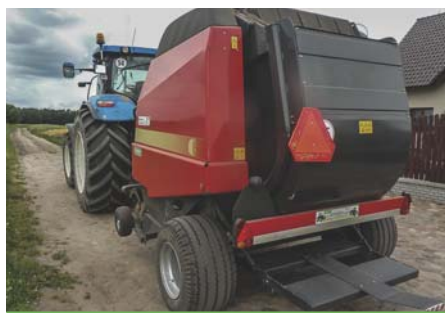
Przejazd po drodze publicznej z prasą wyposażoną w światła i trójkątną tablicę.