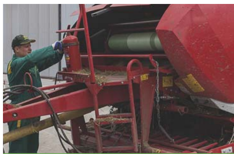
Przed eksploatacją prasę należy wyposażyć w atestowaną gaśnicę.