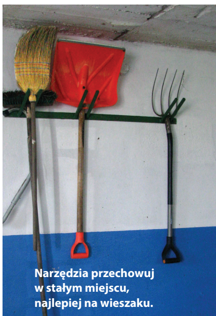
Narzędzia przechowuj w stałym miejscu, najlepiej na wieszaku.